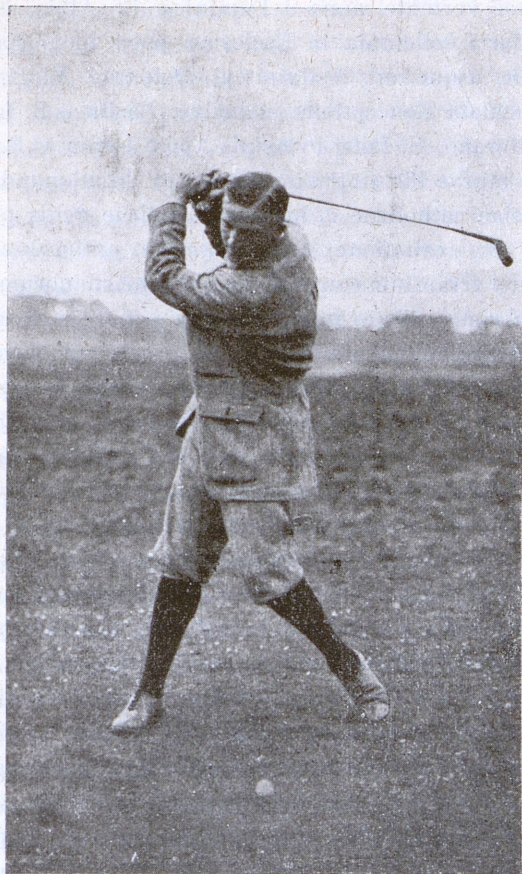
FERNIE pilam propulsurus.

— Bene iacet, certe! Tu-ne nunc tentabis, amice mi? Nonne semel saltem pilam propellere audeas? Audio