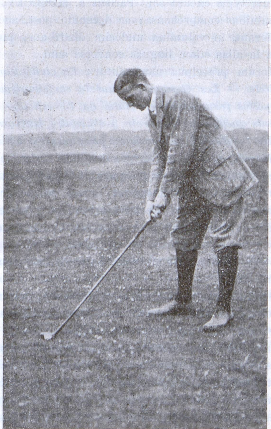
FERNIE, lusorum «Golf» in Scotia princeps an. 1911, «pilam alloquens».

Clavulam ergo, capite eius aequo pone pilam habito, paulisper vacillo, ut pedes meos esse firmos omniaque libera et aequa sentiam; («pilam alloqui» id vulgo dicitur); eamque extollo adeo ut manus prope humerum dextrum sint. Exinde tota curo vi ut descendat quasi circum, cuius in peripheria punctum sit media pila velociter mihi describendum; eoque confecto, manus in humero sinistro, clavula in tergo ni-