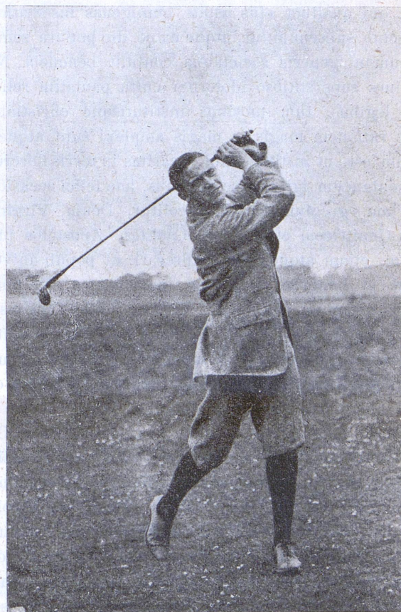
FERNIE post ictum pilae datum.

Rex enim Britannorum, eiusque administri, tam res gerentes quam emeriti, sunt clavigeri, qui cavernas non semper vitare sciunt. Quid? Nonne senes etiam octogenarios et feminas adolescentes pilam in cursu sequi solitas videmus, qui ambulationem sub dio corporisque lene exercitium valetudini suae plurimum conferre affirmant? Sed «Golf» ludus iuvenes bonos mores quoque docet; quamvis enim certantes golfinis iocis frequentioribus gaudeant, nemo nisi stultus, cito vitandus, malis utitur verbis. Esse iustum erga adversarios,