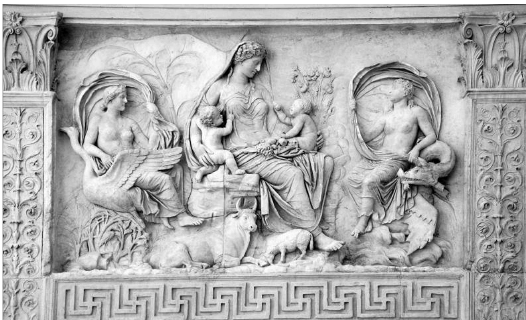
Tellus Mater in Ara Pacis