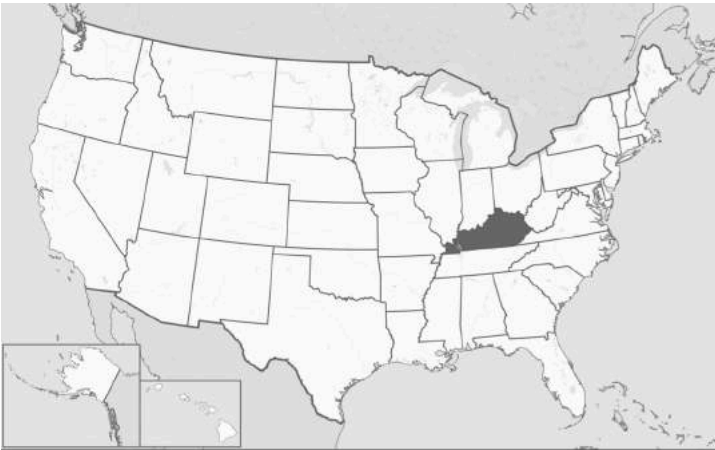
Atro colore: Kentukia (Wikipedia)

Academiae sodalibus more solito habeantur.