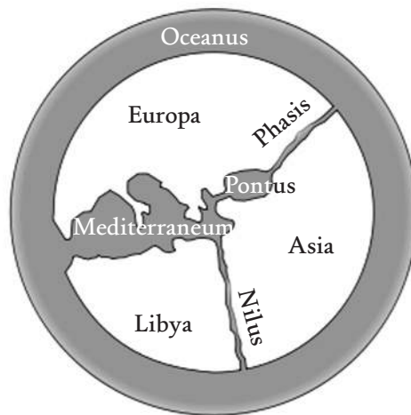
Orbis mappa secundum Anaximandrum, qualis fuisse putatur.

Anaximandrus Milesius , discipulus successorque Thalidis in eius schola philosophica, primus est, qui scripserit περὶ φύσεως, i.e. «de natura», et inde «physicus» vocatus est; fuit astronomus, mathematicus et geographus; primus dicitur esse, qui solutis verbis in scriptis usus sit. Anaximandrus quærebat Universi explicationem rationalem, non mythicam; quare habetur ut pater cosmologiæ. Principium originale habebat ἄπειρον, i.e. «infinite», æterna totaque causa generationis et deletionis omnium rerum. Anaximandrus primus mente concepit Universum esse machinamentum, ubi astra circumcursantia a Terra diversis mensuris distarent; intellexit Solem ingentem esse et ergo longinquissimum. Ab Antiquis habebatur ut primus geographus, quippe qui mappam totius orbis tunc noti delineavisset.