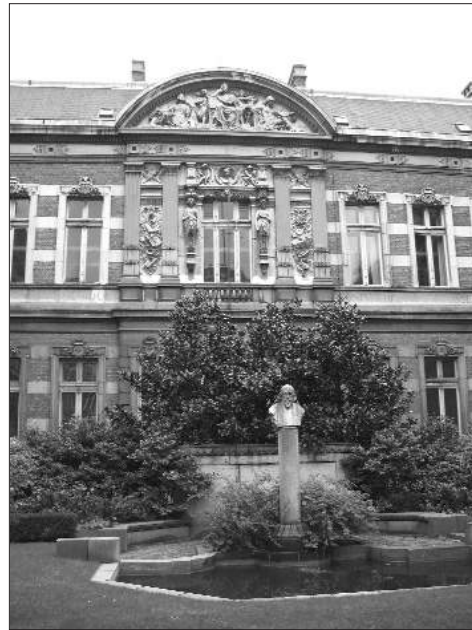
Supra: Academia Musica cum berma Augusti Gevaert. Ad sinistram: Vestibulum Academiae Musicae.

ARTIVM LIBERALIVM PATRONI HANC ÆDEM MVSICÆ ARTIS STVDIOSIS ÆRE PVBLICO EXSTRVCTAM 4 DEDICAVRVNT PRIDIE ID[VS] FEBR[VARIAS] ANNI MDCCCLXXVI. 5 CAROLO DELCOVR 6 RERVVM REGNI [INTERNARVM SVMMO PRÆFACTO AVGVSTO BEERNAERT 7 OPERVM PVBLICORVM [PER FINES REGNI SVMMO PRÆFACTO AVGVSTO GEVAERT 8 SCHOLÆ RECTORE