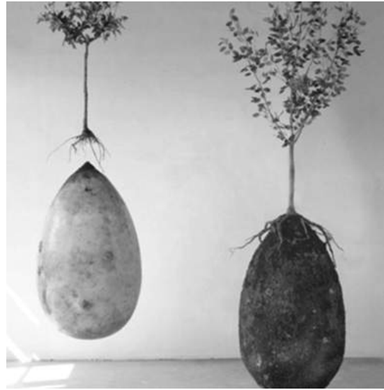
Corpus defuncti, positione fetus, ponitur in amyli capsula, supra quam plantatur arbor. Imago:

At fortasse toto cælo distas ab huiusmodi cupidinibus? Fortasse insani tibi videntur ei, qui aerem post mortem adhuc polluunt? Fortasse natura servanda tibi est curæ? Tum verte te ad «viridia», quæ dicuntur, funera. Nostris temporibus multi homines ad terram redire cupiunt modo «quam maxime naturali». Non in omnibus autem civitatibus sepeliri licet simplici linteo coopertum. Quæramus ergo capulum œcologicum. Multi libitinarii, novos mores respicientes, capulos vendunt «œco-certificatos», ut eos vocant, id est ligno quidem confectos, at nullo synthetico glutino adhibito, intusque vestitos sive maizii amylo 3 sive pinea cellulosi. Minus autem libenter capulos vendunt confectos charta papyracea, ligno regyrato, bambusa, palma aut