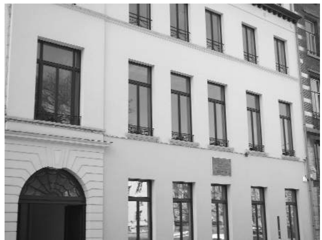
Ædes legationis Pontificiæ s. XIX.