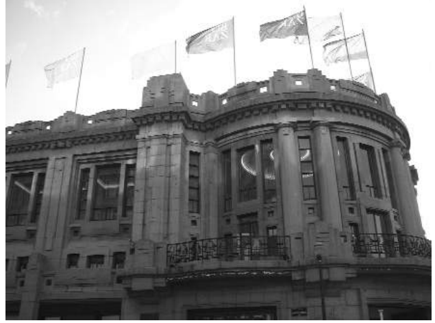
Aedes Artium Liberalium.