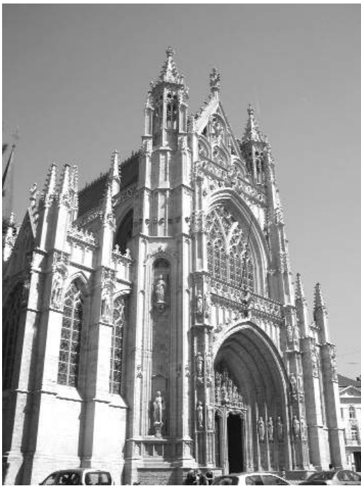
Ecclesia B.M.V. ad Sabulonem.

19. Annis sc. 1878-1903. Natus erat anno 1810.