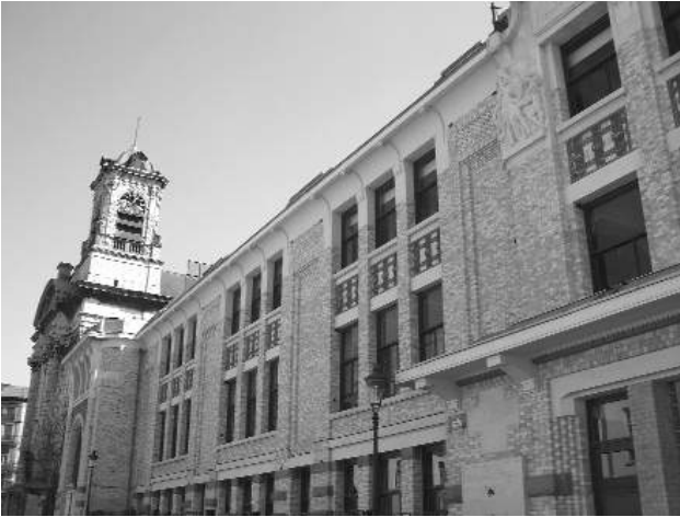
Athenaeum publicum cum aede Minorum.