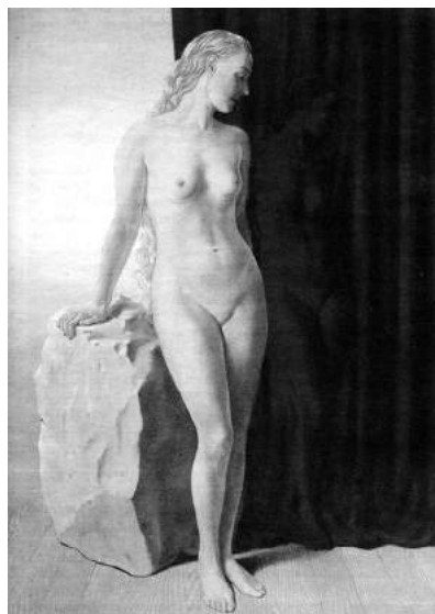
René Magritte (1898-1967), « L'aimant »

Habetne Alberti sententiam de hac quæstione proferendam? Habet: « Quis negabit omnibus in rebus cum publicis tum privatis, profanis religiosisque picturam sibi honestissimas partes vendicasse, ut nullum artificium apud mortales tanti ab omnibus existimatum inveniam? Referuntur de tabulis pictis pretia pæne incredibilia. Aristides Thebanus picturam unicam centum talentis vendidit. Rhodum non incensam a Demetrio rege, ne Protogenis tabula periret, referunt. Rhodum ergo unica pictura fuisse ab hostibus redemptam possumus affirmare. » Palmam tamen in hac re meretur Zeuxis, cuius ars tanta fuisse dicitur, ut aves carperent uvas in tabula ab eo depictas: « Zeuxis pictor suas res donare cœperat, quoniam, ut idem aiebat, pretio emi non possent. Nullum enim pretium existimabat