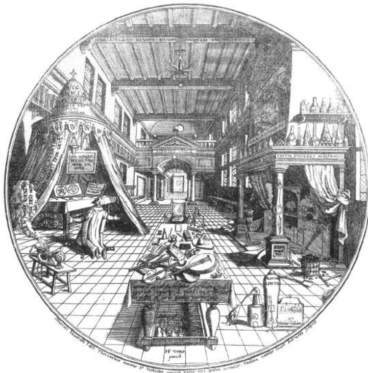
Hans Vredeman de Vries, Laboratorium, in : Heinrich Khunratb, Amphitheatrum sapientiæ æternæ, 1602. Hac imagine optime illustratur alchemica sententia « ora et labora ». Alchemistæ enim erant homines pii qui, ut ex eorum tractatibus patet, sæpe referebant ad Deum.