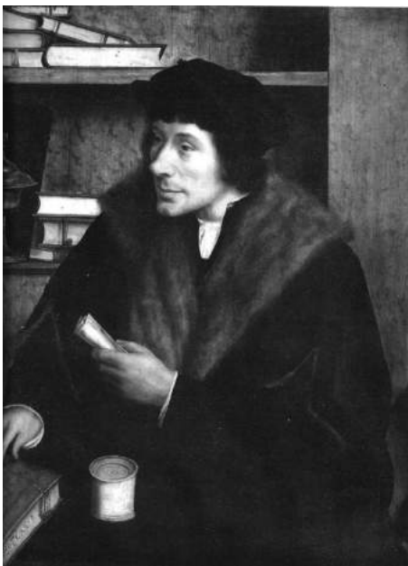
Petrus Ægidius a Quintino Metsys depictus (post 1514 - Antverpiæ, Koninklijk Museum voor Schone Kunsten)

Non iocabantur illis temporibus pictores : nobis enim inter cecos ambulantes monstrabantur, non prata viridia dulcesve deorum amores, sed innumeræ Virgines, Christi, crucifixiones, sancti Sebastiani, alii martyres quantum fieri potest crudelissime trucidati, canonici ad Mariæ genua procumbentes, pauci homines privati, semper maxime severi ; inter hanc omnem