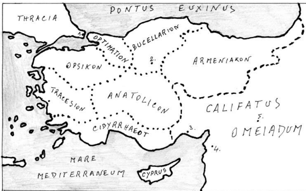
Status Imperii Byzantini medio septimo sæculo. Indicantur limites thematum; cunctæ insulæ faciunt thema nautarum.

Tempore Heraclidarum, Imperii Romana divisio administrativa mutata est; novæ divisiones maiores sunt; numerantur septem vel octo; eis nomen datur « thema », quo primum designatur pars exercitus, quæ ibi sedem habet, et reguntur a stratego. Tota Imperii administratio facta est militaris; hæc condicio etiam propria est Medii Ævi. ☩