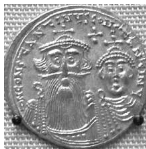
Nummus Constantii II (British Museum) ; novus mos inter principes est mystacem gerere.

Quæ cum ita sint, non mirum est si Arabes Ægypto imprimis, deinde tota Africa septentrionali potiuntur sine magna Byzantinorum resistentia. Alexandria anno 642 capta, volumina præstantissimæ bibliothecæ alunt thermarum præfurnia ; califa Omar dicitur decrevisse « omnem librum cum Corano consentaneum supervacaneum esse et omnem librum Corano contrarium esse blasphemum ».