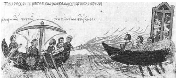
Ignis liquidus talis, qualis in chronicis Iohannis Skylitzes ostenditur.

vastatoriam in Asiam Minorem quotannis facere iam solent, nunc sub Constantinopolis mœnia perveniunt. Tamen non solum Constantinus IV, qui inter Heraclidas fortitudine eminet, quinque annos (673-678) mahumetanorum obsidionem sustinere valet, sed insuper eius classis, ope ignis liquidi modo inventi, terribilem cladem infert classi Damasci califæ Mu'awiya. Etiam in Asia Minore mahumetanorum exercitus vincitur, ita ut califa pacem facere debeat. Præstantia Imperii restituitur.