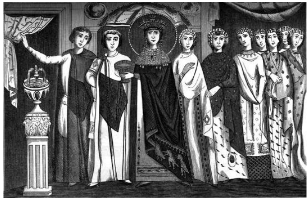
Imperatrix Theodora cum pedisequis, ex opere musivo basilicæ sancti Vitalis, Ravennæ (Revue archéologique, 1850).

Quomodo Iustinianus eam invenerit, manet in dubio. Procopius de hac re nihil dicit ; secundum alios fontes internuntius fuit quidam saltator, Macedonia nomine, qui erat unus ex Iustiniani speculatoribus, cum is esset magister militum. Iustinianus, statim