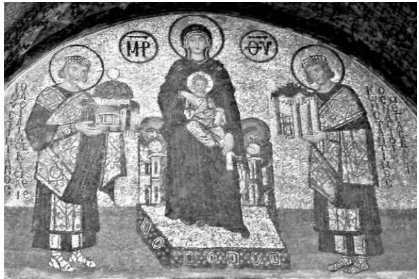
A sinistris : Iustinianus (Constantinopoli in ecclesia sanctæ Sophiæ).

Iustinianus libenter solet ædificare. Optimi architecti artificesque, quibus præbet opes infinitas, scientiis, audacia et magnificentia utentes Byzantinam ædificandi artem ducunt ad fastigium insuperatum. Adhuc admirari licet nonnulla illius ætatis monumenta, basilicas, ut basilicam novam Sancti Apollinaris Ravennæ, basilicam Sancti Demetrii Thessalonicæ, ecclesias polygonias, ut ecclesia Sancti Sergii et Bacchi Constantinopoli aut Sancti Vitalis Ravennæ et supremum miraculum, Sanctam Sophiam Constantinopoli. ❖