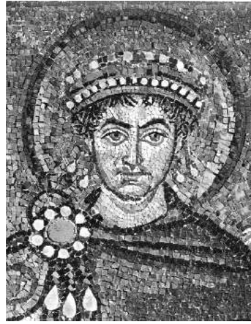
Iustinianus (basilica sancti Vitalis, Ravennæ – imago plena ostenditur p. 14).

Dum Palatium quinque dies obsidetur, nonnulli senatores novum imperatorem eligunt, Hypatium, præcedentis imperatoris Anastasii I nepotem. Ab omni spe derelictus, Iustinianus aufugere vult, at Theodora negat, dicens, ut fama fert: « Diem videre nolo, quo ut imperatrix iam non saluter! ». Novo consilio capto, Narses, eunuchus apud plebem graciosus, mittitur in hippodromum cum magna auri copia; Venetorum factionem solus statim petit et, dum aurum distribuit, rectores commonefacit beneficiorum Iustiniani, qui