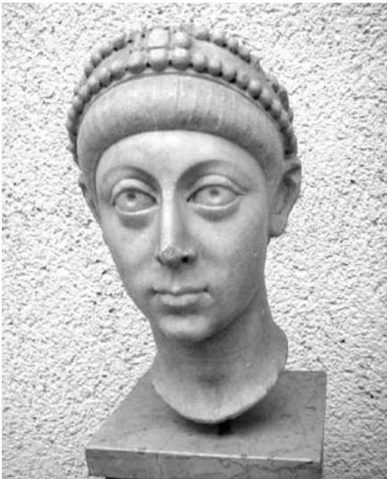
Arcadius (Constantinopoli in museo archæologico).

Italiæ divitiæ non desinunt barbaros allicere. Ostrogothus Radagaisus cum exercitu ex Gothis, Vandalis, Alamanis et Alanis constante Danuvium transit, nemine obstante, atque in Italiam septentrionalem anno 406 irruptionem facit. Secum ducit non solum ducenta circiter milia bellatorum, sed etiam ingentem turbam eorum familiarium. Mediam Italiam statim petit, sed Stilicho eum prope Florentiam continet et deinde Fæsulis profligat; exercitus, Radagaisus ipse et totus grex sive exterminatur sive fame perit, præter Gothos, qui in Pannoniam se recipiunt. Iterum