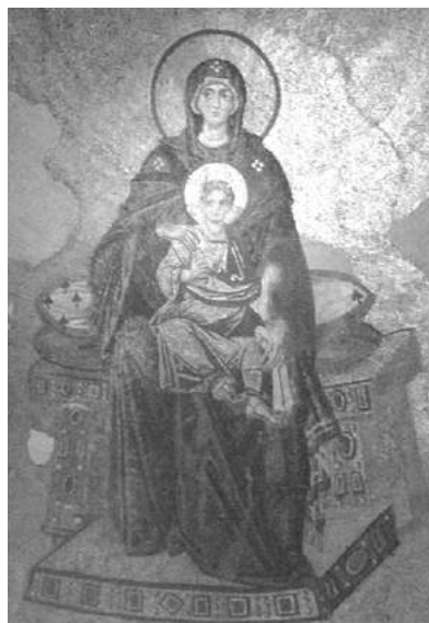
Virgo θεοτόκος (Constantinopoli in ecclesia Sanctæ Sophiæ).

Nestorius, in Euphratæa Syria anno 386 natus, litteras Græcas Germanicæ discit, deinde Antiochiam petit, ubi imbuitur doctrina scholæ theologice Antiochensis. Sacerdos ordinatus, vitam monachalem eligit et famam optimi oratoris acquirit. Quare imperator Theodosius II eum anno 428 Constantinopolin