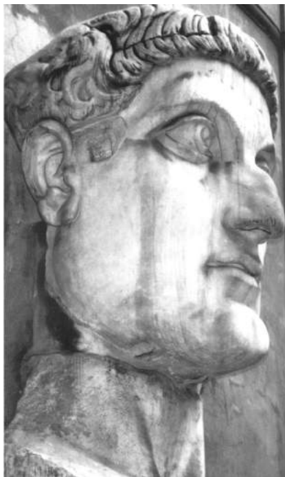
Pars Constantini statuæ olim in Maxentii basilica positæ, nunc autem in aula Ædium Conservatorum.