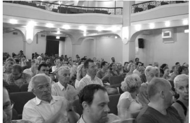
In urbis Pompeiorum novo odeo.