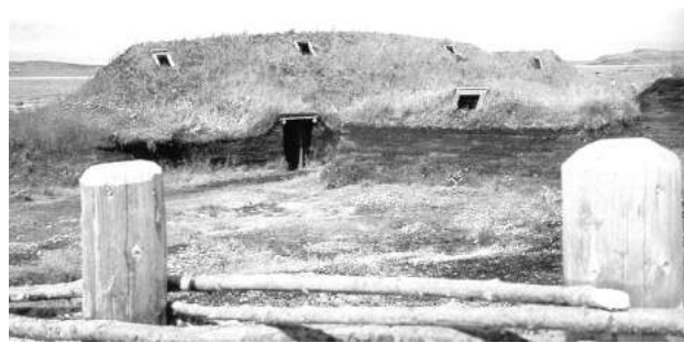
Domus Vikingianæ reconstructio.

America septentrionalis recta navigatione 1.500 chiliometris distat a Terra Viridi. Tantum iter per altum facere non valent naves Vikingorum ; quare, quantum fieri potest, secundum litus navigant, sed sic iter fit