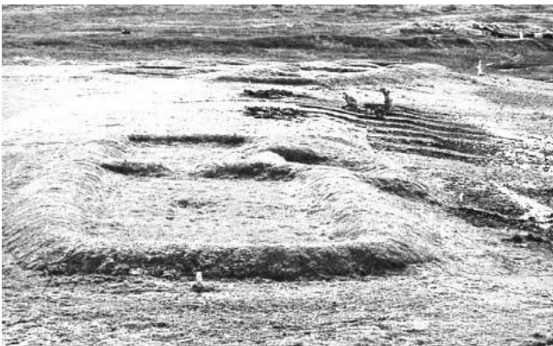
Ædificiorum reliquiæ (hic in Terra Nova) vix sunt visibiles.

Initio Vikingi eadem animalia ac in Norvegia pascent, sed mox animadvertunt hoc fieri non posse. Nullas aves cohortales et mox nullum porcum iam habent, quamquam suillam præ ceteris carnibus amant ; porci enim solum effodiendo vegetalibus mul-