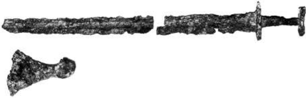
Res inventæ : gladius, securis.

dupliciter longum. Transito freto a Davis nominato ad occidentem versus, tangunt insulam Baffini ( Helluland ), cuius litus sequuntur ad meridiem. Transito exiguo Hudsoni freto, tangunt partem continentis Americæ septentrionalis, quæ hodie vocatur « Labrador » ( Markland ). Navigationem ad meridiem pergentes, inveniunt insulam, Terram Novam hodie vocatam, amplum sinum fluminis Sancti Laurentii et litora ultra ad meridiem sita, quæ « Vinland » vocant propter feras vites ibi repertas.