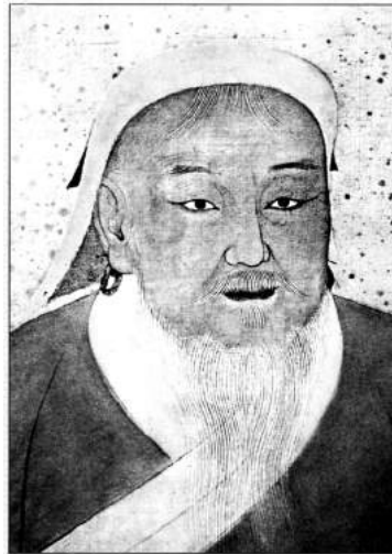
Imago Tingis Khani in Sinis facta et in Pekinensi domo regia adhuc servata.

Moscoviæ Ivanus IV, Terribilis cognominatus. Medio sexto decimo sæculo eius exercitus, cannonibus instructus, reliquos Russiæ khanatus expugnat ; viri trucidantur, feminæ et pueri in servitudinem rediguntur. Anno 1581 Russorum arma primum transgrediuntur montes Urales et steppas Sibiricas invadunt, quibus intra unum sæculum potiuntur usque ad oceanum Pacificum. Pauci nomades, qui supersunt, facti sunt impotentes... ❄