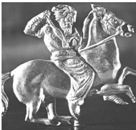
Scythæ fingitur hoc aureo ornamento quarto sæculo a.Ch.n. confecto, quod in Chersoneso Taurica est inventum.

Ex tot indomitis equis, qui per steppam olim vagabantur, tantum nonnulli centeni supersunt, quos Russus explorator Przewalski undevicesimo sæculo in media Sibiria invenit ; immutati erant a tempore, quo in nonnullis Europæ speluncis delineati sunt, i.e. ante viginti circiter milia annorum.