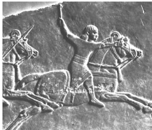
Hic eques Assyrius septimo sæculo a.Cb.n. in equo efficaciter sedet.

Anno 1220 in Sogdianam irrumpit, ubi Boukhara et Maracandam (Samarqand) expugnat, deinde Afghaniam, Khorâssân et Iraniam pervadit, ubi multi incolæ iam sunt mahumetani. Hoc fit cum solitis cædibus ; incolæ urbis Merv, postquam se reddiderunt, omnes iugulantur ; Tului, Mongolorum exercitus dux, in sella aurata sedet, dum cædem contemplet : viri, feminæ et pueri separati et in greges distributi ad equitum turmas pro-