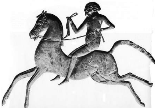
Hæc est vetustissima equitis imago. Pertinet ad scenam prælii, quod in Ægypto factum est circa annum 1350 a.Ch.n. Notanda est inepta equitis positio.

legerant, eodem modo hostes « scalpebant ».