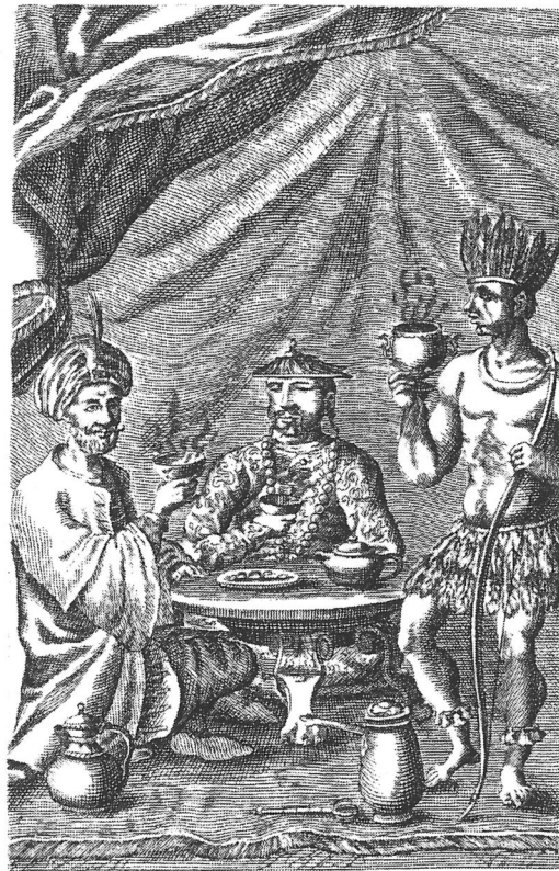
TRAITES NOUVEAUX & CURIEX DV CAFE DV THE, ET DV CHOCOLATE Composéz Par Philippe, Sylvestre Dufour.

4. Antioxydantia : his substantiis impediuntur radicalia libera, instabiles moleculæ quæ genus nocere possunt, et minuitur cholesteroolum.