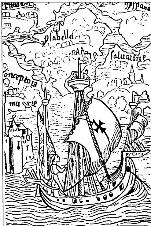
Hac imagine ornatur quaedam editio 'Epistolae Christophori Columbi' anno 1494 in publicum propositae. Cfr p. 6.

Vanissimum est programma ab administris publicis impositum. Veris studiis succedit regnum inanis garrulitatis atque opinionis proferendae, quasi valeat opinio firmis fundamentis carens. In programme historiae geographiaeque, verbi gratia, proponuntur themata huius generis: «de civilizatione communicationis» vel aliud tam stultum, ut ipse non