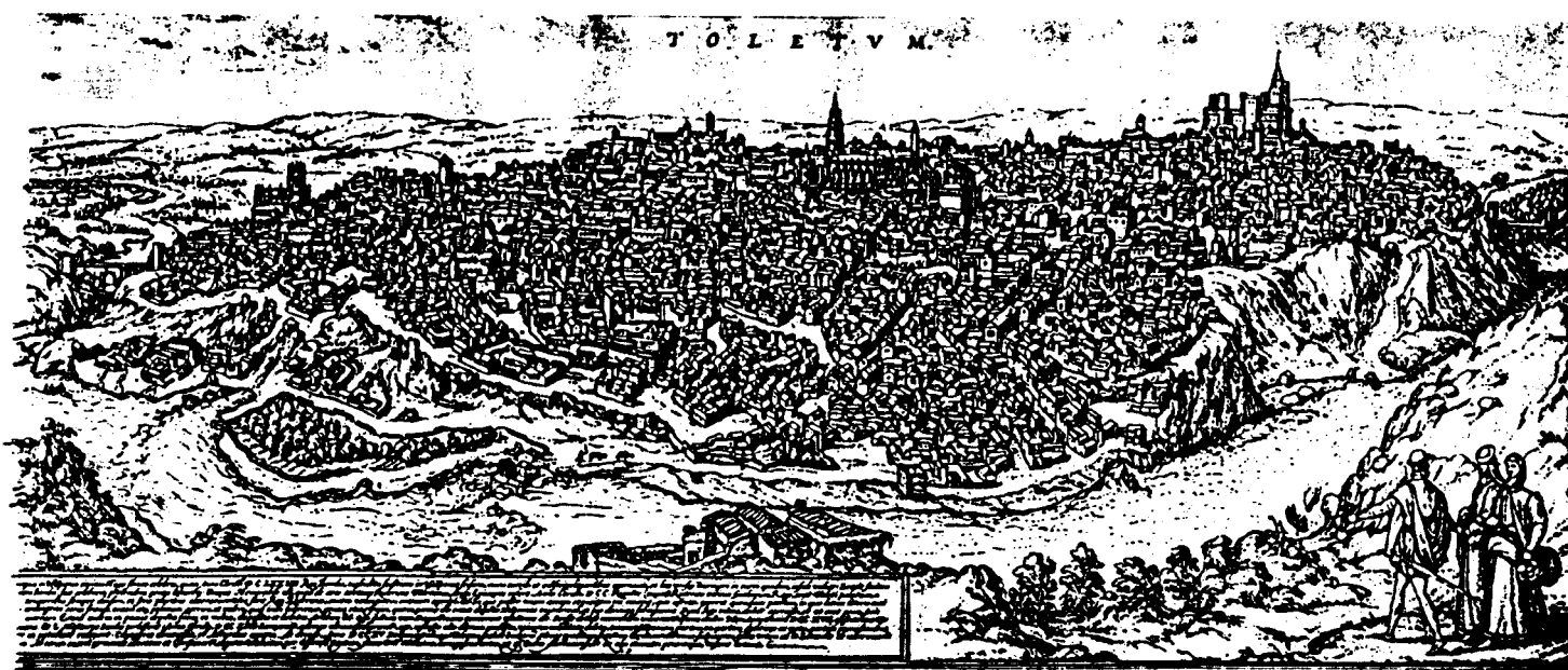
Imago excerpta ex libro, cui titulus "Civitates Orbis Terrarum" (Ed. Braun et Hogenberg 1572 -1618)