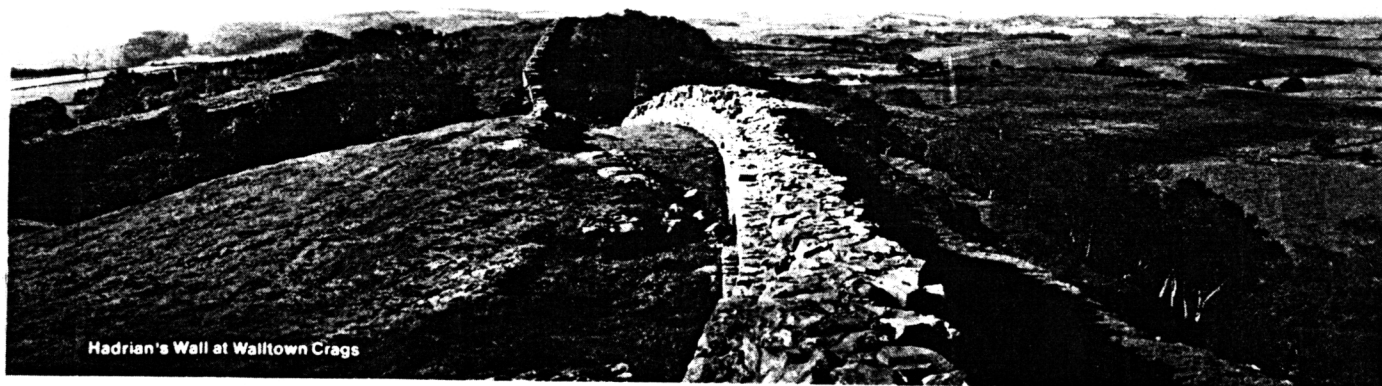
Hadrian's Wall at Walltown Crags