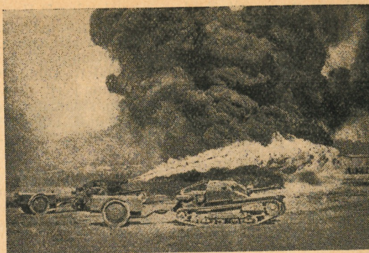
Currus bellici novissimi flammaram missores.

Accidit autem aliquando, ut quidam praefectus militum vulneratus curandi causa huic feminae traditus sit. Cum vero cognosceret hanc esse speculatricem illam, quae olim e manibus effugisset, ut caperetur, clamorem ingentem sustulit.