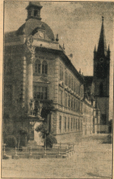
Gymnasium Keszthelyiense (luce pinxit Aem. Láng).

Gymnasium Praemonstratensium Keszthelyiense mense Decembri sollemnia semisaecularia cele-