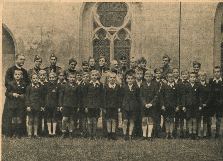
Archiabbas Chrysostomus Kelemen et legatus Italiae nomine Da Vinci cum discipulis gymnasii Italiani in Monte Pannoniae.