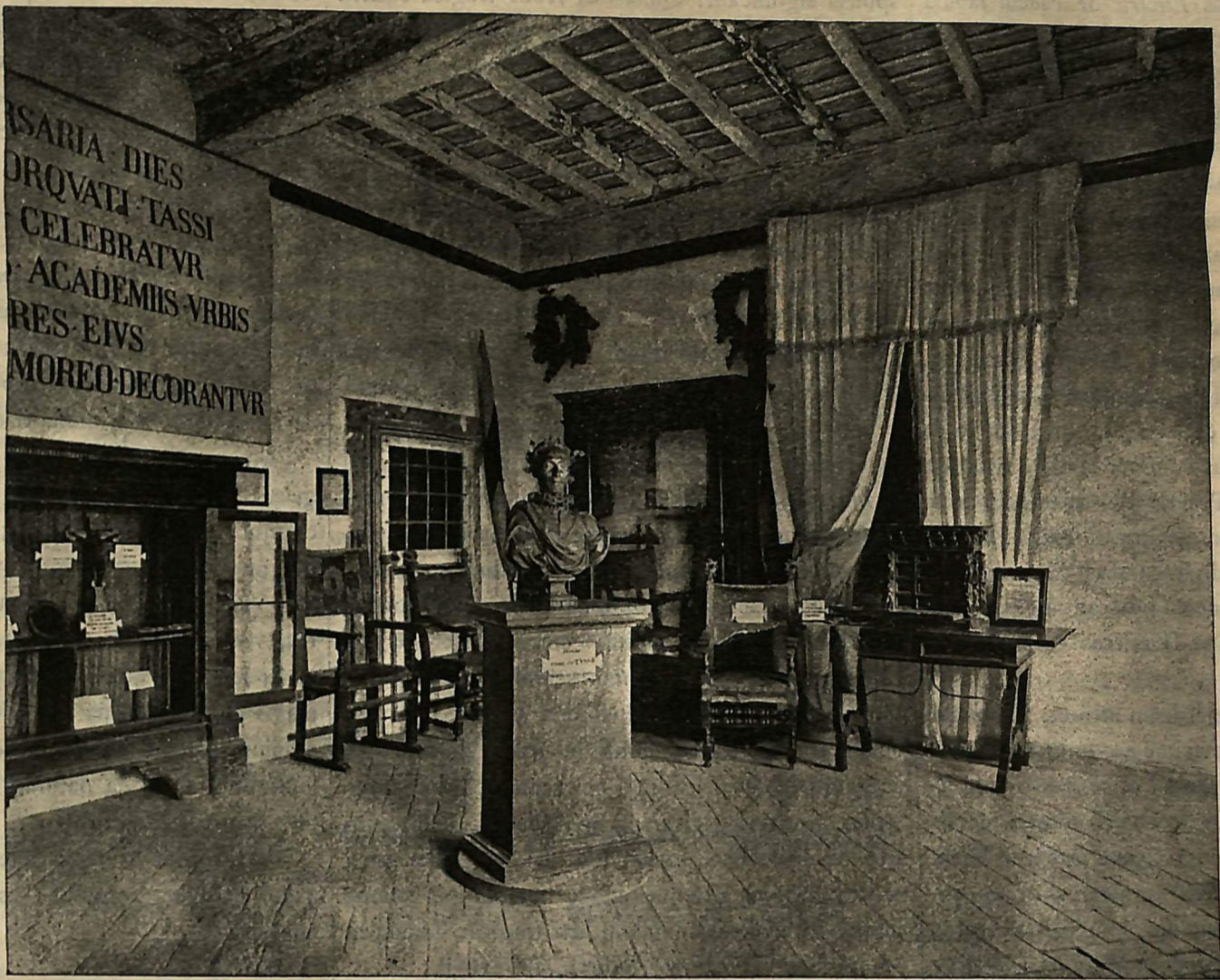
Cubiculum ubi T. Tassus decessit, Romae ad S. Honuphrii.

rent, accidit ut maritimum consuetudo itinerum ob commercii causam increbresceret; quare et necessitas increbuit lumina ad oras multiplicandi. Idque in usum deductum est non modo in Italia, sed etiam in aliis Europae regionibus, in Dania praesertim atque in Anglia, quae ceteris nationibus, si Italiam excipias, maritimum itinerum audacia ac prudentia praestiterunt. In Anglia autem tot tantisque curis navigantium salutem provisum est, ut coetus quidam institueretur, cui nomen «Trinitatis Fratres» ( Trinity House ) quique sibi propositum haberet Angliae oras, periculosis praesertim in locis, noctu lumine il-